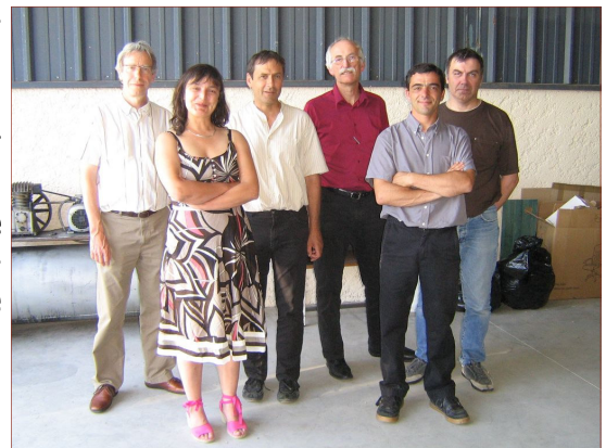
L'équipe O2E et les membres d'IÉS (accompagnateurs et président)

Ils sont tous les deux employés à temps partiel sur le Bio Atelier de Bigorre.